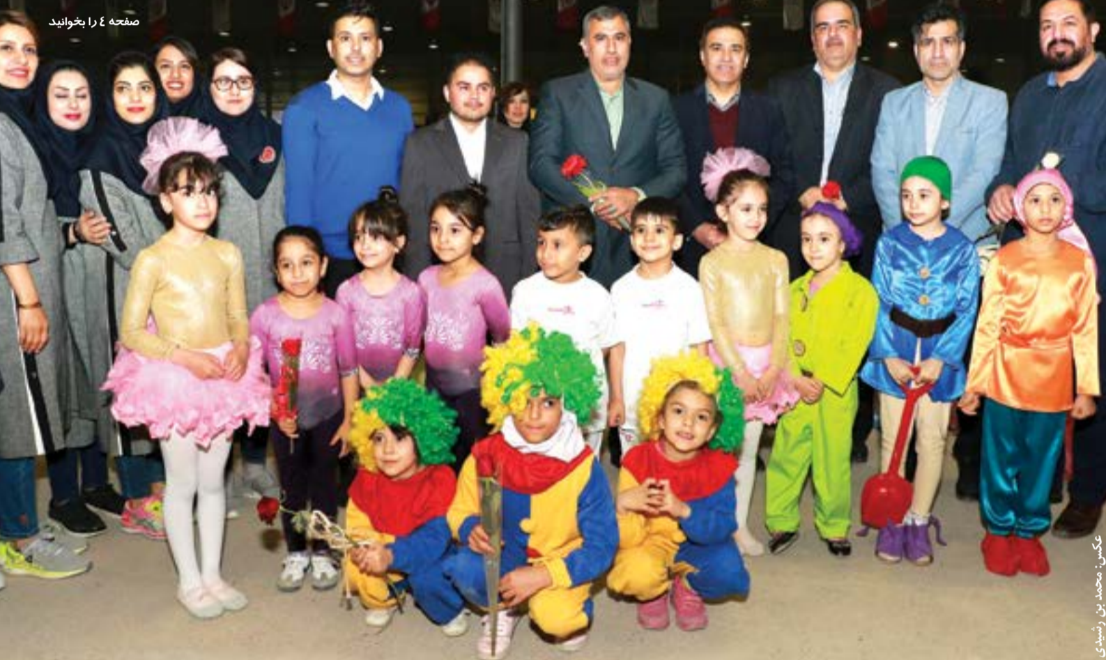
صفحه ۴ را بخوانید