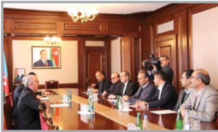
گزارش: غلامرضا مشایخی

به توضیح محصولات این نمایشگاه پرداخته و نحوه تولید، بسته‌بندی و بازاریابی محصولات را به صورت مشروح توضیح داد. وی گفت: این نمایشگاه به گونه‌ای طراحی شده است که تمام محصولات تولیدی نخجوان را در برمی‌گیرد.